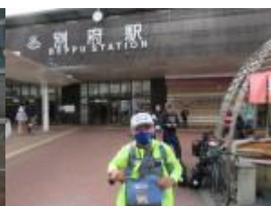
※西鉄リゾートイン、トキハ、別府駅