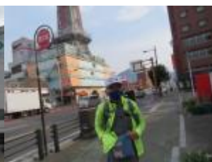
※別府タワーを見ながら歩く