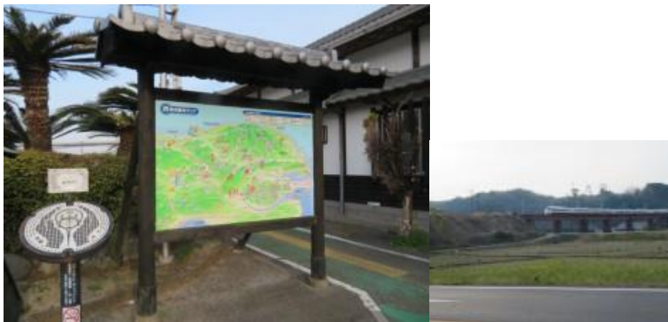
※杵築駅、大神駅への路