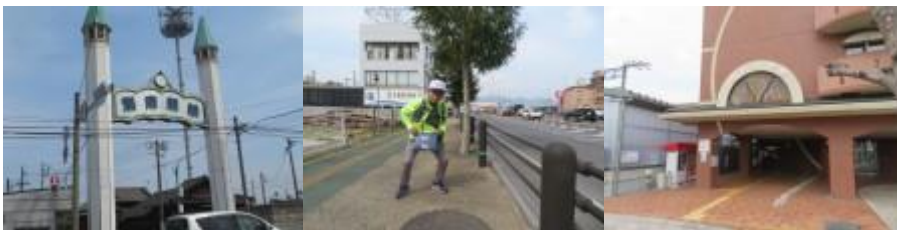
※別府競輪、門司から122 km地点、別府大学駅

⑥13時7分、弁天前バス停（大分交通、亀の井バス）を通過。13時13分、市姫神社前を通過。13時16分、別府競輪前を通過。13時23分、門司から122 km地点を通過。13時37分、別府大学駅に到着。