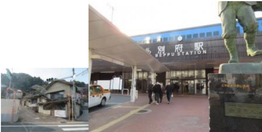
※別府駅への路、別府駅

APU は APU 入口から 15 分位行った山間にあり、見晴らしは抜群であった。バス便も 1 時間に 4 から 6 便位あった。宮崎交通と亀の井バスの 2 社が別府駅を起点に乗り入れていた。APU を起点に時計回りが宮崎交通、反時計回りが亀の井バスとなっていた。後者の路線バスの経路は、地獄めぐりを經由するコースであった。この状況を把握していなかったため、多少非効率の旅行程となった。事前勉強しておく、明礬湯の里に立ち寄ることも可能であった。