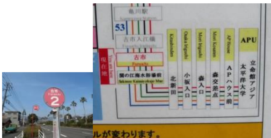
※大分交通の亀川（古市）バス停

空港からはリムジンバスで亀川（古市）バス停へ。そこから路線バスで立命館アジア太平洋大学（APU）に向かう。APU は母校の立命館大学の姉妹校なのでいつか訪問をしたいと考えていた。具体的には去年の長崎の旅で訪問を予定していたが、急遽予定を変更し、唐津線の踏破のため延期となった。そのリベンジが本日となった。