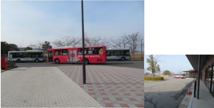
※APU バス停（赤いバス：大分交通、青いバス：亀の井バス）

APU は APU 入口から 15 分位行った山間にあり、見晴らしは抜群であった。バス便も 1 時間に 4 から 6 便位あった。宮崎交通と亀の井バスの 2 社が別府駅を起点に乗り入れていた。APU を起点に時計回りが宮崎交通、反時計回りが亀の井バスとなっていた。後者の路線バスの経路は、地獄めぐりを經由するコースであった。この状況を把握していなかったため、多少非効率の旅行程となった。事前勉強しておく、明礬湯の里に立ち寄ることも可能であった。