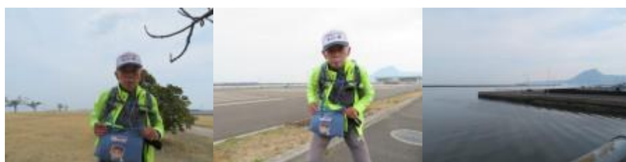
※上人ヶ浜公園からの風景